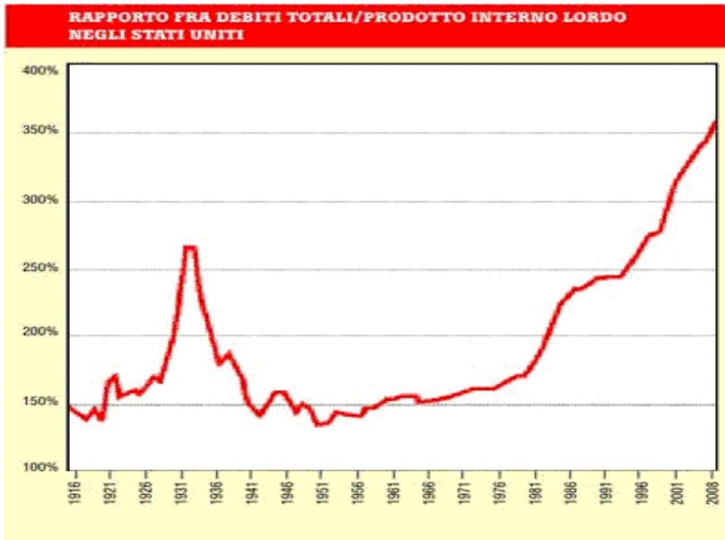
Rapporto tra debiti totali e prodotto interno

lordo negli Stati Uniti nel periodo 1916-2008.